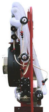
model VINAR-KIT k montáži na starší postřikovače