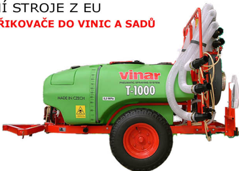
model VINAR T k postřikování vinic a sadů