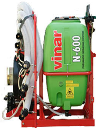
model VINAR N k postřikování vinic a sadů